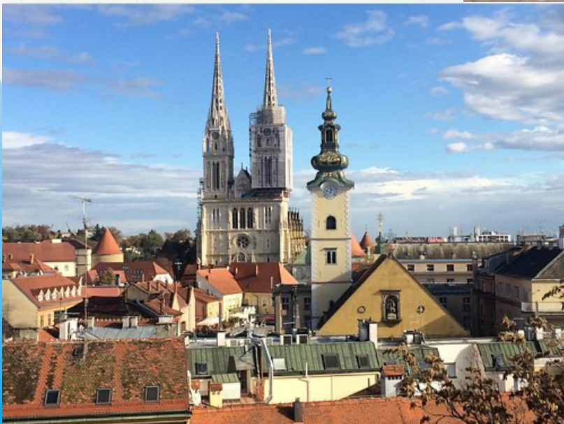
“Nhà thờ Zagreb”

Đây là tòa nhà cao thứ hai ở Croatia và cũng là tòa nhà thiêng liêng hoành tráng nhất theo phong cách kiến trúc Gothic ở phía đông nam của dãy núi Alps. Nó được dành riêng cho Giả định của Mary và các vị vua Saint Stephen và Saint Ladislaus. Nhà thờ thường mang phong cách Gothic, cũng như phòng thánh của nó, có giá trị kiến trúc lớn.