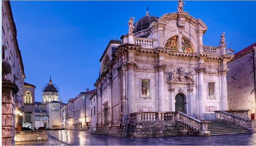
“Nhà thờ St. Blasius,”

Một trong những tòa nhà thiêng liêng đẹp nhất ở Dubrovnik, Nhà thờ St Blaise ngày nay. Thánh Blaise đã được vinh danh là vị thánh bảo trợ của Dubrovnik từ thế kỷ thứ 10. Theo các nhà biên niên sử của