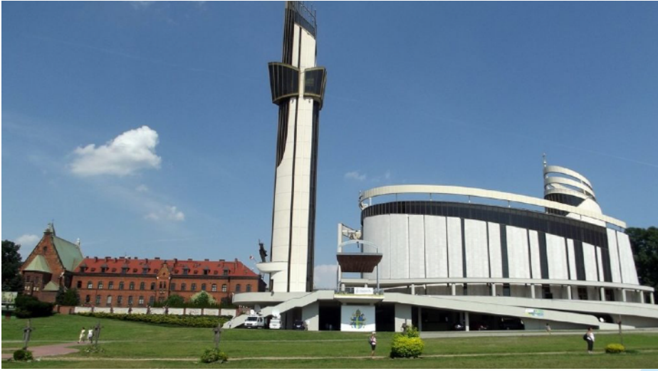
“Shrine of Divine Mercy”

Đền thờ Lòng Thương Xót Chúa ở Kraków, Ba Lan là một vương cung thánh đường Công giáo La Mã dành riêng cho lòng sùng kính Lòng Chúa Thương Xót, và là nơi an nghỉ của Thánh Faustina Kowalska, được phong thánh ngày 30 tháng 4 năm 2000.