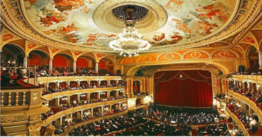
“State Opera House”

Vienna State Opera là một nhà hát opera và công ty opera có trụ sở tại Vienna, Áo. Địa điểm Phục hưng Phục hưng 1.709 chỗ ngồi là tòa nhà lớn đầu tiên trên Đường vành đai Vienna. Nó được xây dựng từ năm 1861 đến năm 1869 theo kế hoạch của August Sicard von Sicardsburg và Eduard van der Nüll, và thiết kế của Josef Hlávka