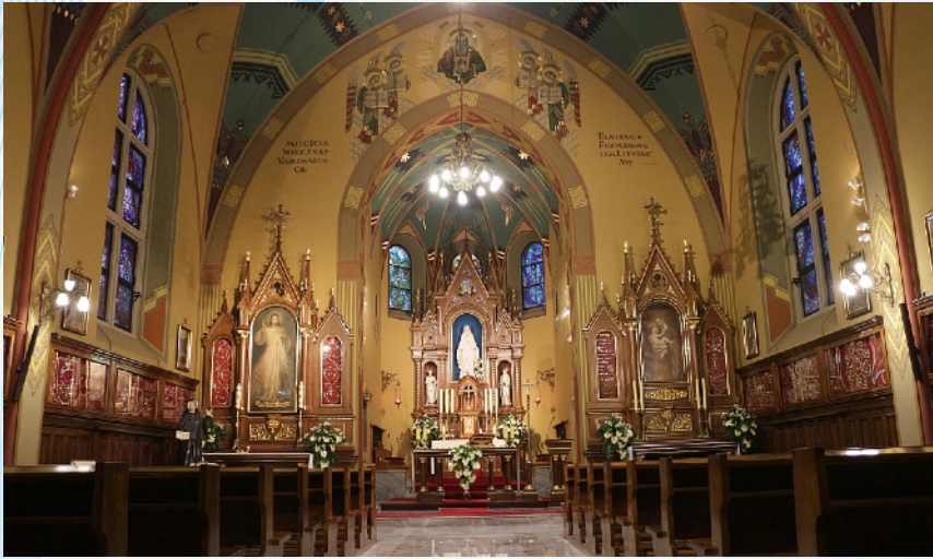
Lòng Chúa Thương Xót - Shrine of Divine Mercy

Đền thờ Lòng Thương Xót Chúa ở Kraków, Ba Lan, là một vương cung thánh đường Công giáo La Mã dành riêng cho lòng sùng kính Lòng Thương Xót Chúa, và là nơi an nghỉ của Faustina Kowalska, được Giáo hội Công giáo phong thánh vào ngày 30 tháng 4, 2000