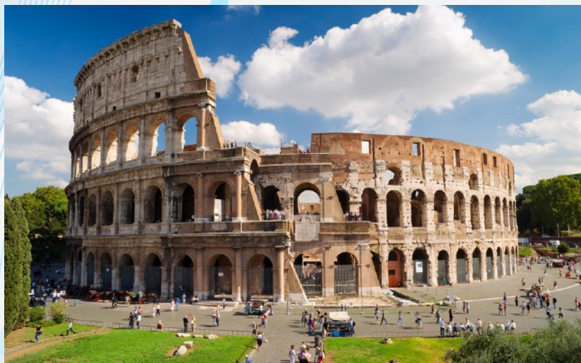
Colosseum in Rome

Một giảng đường hình elip ở trung tâm thành phố Rome, Ý, ngay phía đông của Điện đàn La Mã. Đây là giảng đường cổ đại lớn nhất từng được xây dựng, và vẫn là giảng đường đứng lớn nhất thế giới, bất chấp tuổi đời của nó.